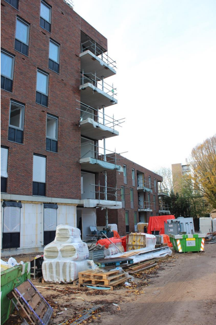
Oprit vanaf Kanunnik Mijllinckstraat