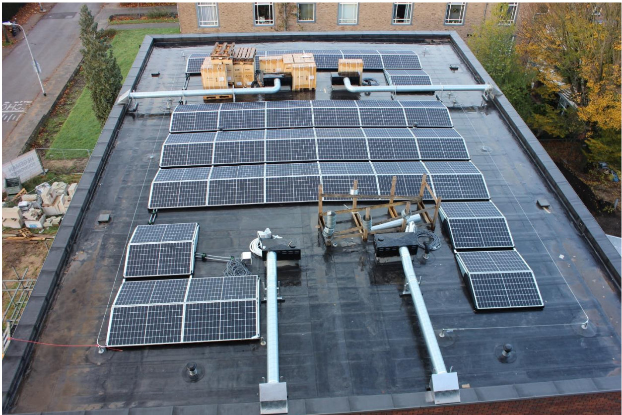
Zonnepanelen op het dak van de laagbouw