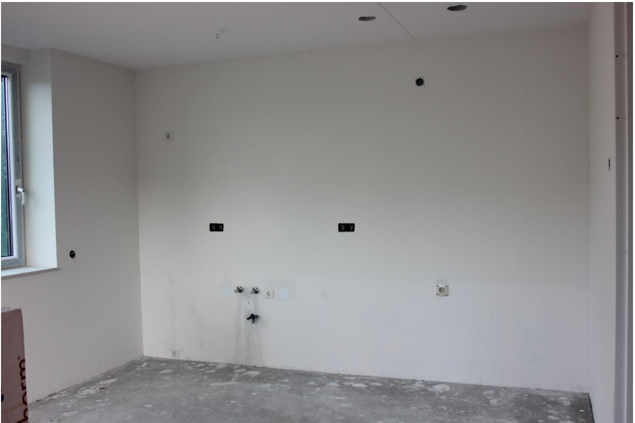
Aansluitingen keuken in de laagbouw