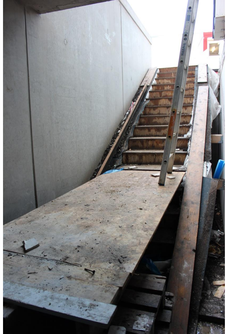
Fietstrap naar de kelder